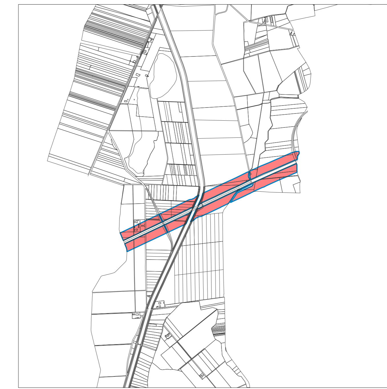
SCALA 1 : 10.000

Livio Comuzzi urbanista - via Cisis, 9 - 33100 Udine Informatizzazione: Stefano Orlando - via Chiusaforte, 60/10 - 33100 Udine