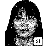
Montatura copre occhi