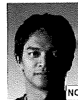
Ombra sul viso