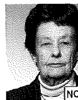
Testa non centrata

La testa deve essere centrata verticalmente.