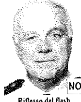
Riflesso del flash