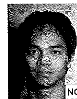
Ombra sulla sfondo

Non devono essere presenti ombre sul viso o sullo sfondo.