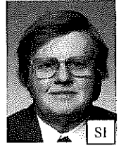
Riflesso sulle lenti