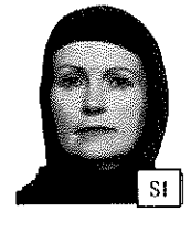
Parte del viso coperta