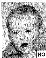
Oggetto in evidenza